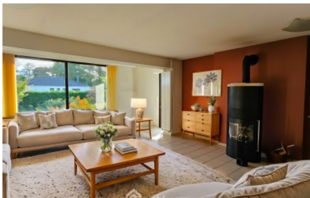
elle non contractuelle proposée par iACrea